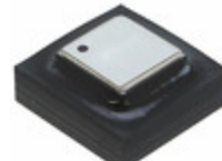
ADIS16265BCCZ Analog Devices Inc. IC SENSOR GYRO PROGR 10MV 20LGA