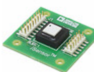
ADIS16266/PCBZ ADI (Analog Devices, Inc.) BREAKOUT BOARD FOR ADIS16266