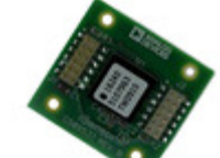
ADIS16240/PCBZ ADI (Analog Devices, Inc.) BOARD EVAL FOR ADIS16240