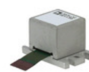
ADIS16228CMLZ Analog Devices Inc. IC SENSOR DIGITAL TRI VIB 15- MOD