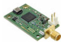
ADIS16229AMLZ Analog Devices Inc. SENSOR VIBRATION W/RF TXRX