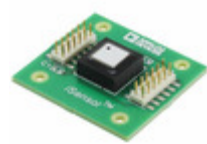
ADIS16265/PCBZ ADI (Analog Devices, Inc.) BOARD EVALUATION FOR ADIS16265