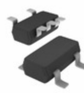
XC7SH32GV,125 Nexperia USA Inc. IC GATE OR 1CH 2-INP 5-TSOP