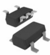
XC7SHU04GV,125 Nexperia USA Inc. IC INVERTER SIGATE CMOS 5TSSOP