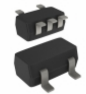
XC7SH86GW,125 Nexperia USA Inc. IC GATE XOR 1CH 2-INP 5-TSSOP