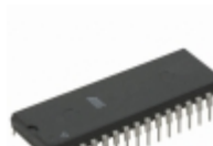
AT49F002N-90PC Microchip Technology IC FLASH 2MBIT 90NS 32DIP