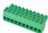
EDZ1550/10 On Shore Technology Inc. TERM BLOCK PLUG 10POS STR 3.81MM