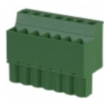
EDZ1200/7 On Shore Technology Inc. TERM BLOCK PLUG 7POS STR 5.08MM