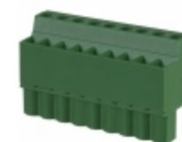
EDZ1200/9 On Shore Technology Inc. TERM BLOCK PLUG 9POS STR 5.08MM