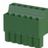
EDZ1200/6 On Shore Technology Inc. TERM BLOCK PLUG 6POS STR 5.08MM