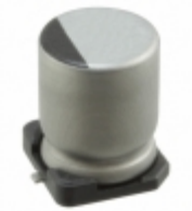
UUR1C471MNL6GS Nichicon CAP ALUM 470UF 20% 16V SMD