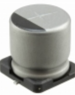
UUR1E221MNL1GS Nichicon CAP ALUM 220UF 20% 25V SMD