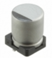
UUR1E101MCL6GS Nichicon CAP ALUM 100UF 20% 25V SMD