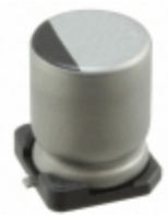
UUR1C221MNL1GS Nichicon CAP ALUM 220UF 20% 16V SMD