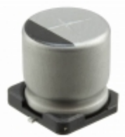
UUR1C471MNL1GS Nichicon CAP ALUM 470UF 20% 16V SMD