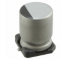
UUR1E221MNL6GS Nichicon CAP ALUM 220UF 20% 25V SMD