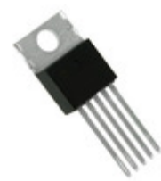
MCP1825-3302E/AT Microchip Technology IC REG LDO 3.3V 0.5A TO220-5