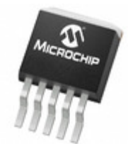
MCP1825-3302E/ET Microchip Technology IC REG LDO 3.3V 0.5A DDPAK