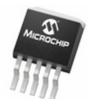
MCP1825-3002E/ET Microchip Technology IC REG LDO 3V 0.5A DDPAK