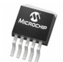
MCP1825-ADJE/ET Microchip Technology IC REG LDO ADJ 0.5A DDPAK