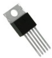
MCP1825-5002E/AT Microchip Technology IC REG LDO 5V 0.5A TO220-5