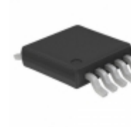
SY55851UKI Microchip Technology IC GATE 3.0GHZ 100OHM 10- MSOP