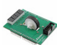
IQS624EV04-S Azoteq IQS624 EVALUATION KIT 4