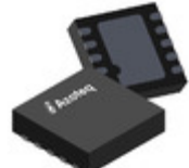
IQS624-500-DNR Azoteq HALL ROTATION, INDUCTIVE AND CAP