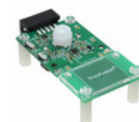
IQS680EV02-S Azoteq DEV