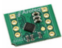
IQS624EV01-S Azoteq IQS624 EVALUATION KIT 1