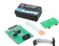
IQS621EV04-S Azoteq IQS621 EVAL KIT 4