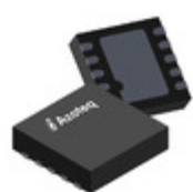
IQS680-100-DNR Azoteq SENSOR PROXIMITY