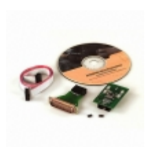
AT86RF401E-EK1 Microchip Technology KIT DEMO MICRO TX EVAL 433MHZ