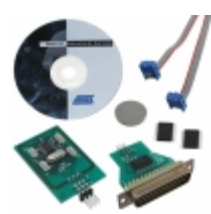
AT86RF401U-EK1 Microchip Technology KIT DEMO MICRO TX EVAL 315MHZ