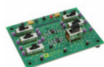
AD633-EVALZ ADI (Analog Devices, Inc.) BOARD EVAL FOR AD633