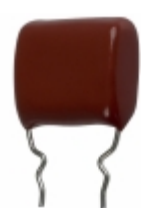
ECQ-P1H104GZW Panasonic Electronic Components CAP FILM 0.1UF 2% 50VDC RADIAL