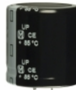
ECE-S2WP331EX Panasonic Electronic Components CAP ALUM 330UF 20% 450V SNAP