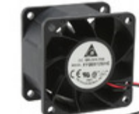
FFB0612SHE Delta Electronics FAN AXIAL 60X38MM 12VDC WIRE