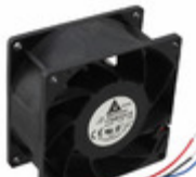
FFB0812EHE-R00 Delta Electronics FAN AXIAL 80X38MM 12VDC WIRE