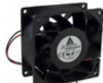
FFB0812GHE Delta Electronics FAN AXIAL 80X38MM 12VDC WIRE