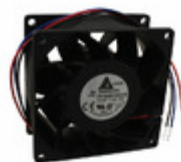
FFB0812GHE-F00 Delta Electronics FAN AXIAL 80X38MM 12VDC WIRE