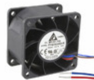
FFB0624EHE-F00 Delta Electronics FAN AXIAL 60X38MM 24VDC WIRE