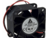
FFB0612VHE Delta Electronics FAN AXIAL 60X38MM 12VDC WIRE