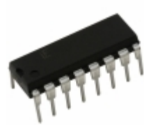
SP720AP Littelfuse Inc. TVS ARRAY ESD 14 INPUT 16-DIP