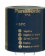
ECE-T1KA682EA Panasonic Electronic Components CAP ALUM 6800UF 20% 80V SNAP