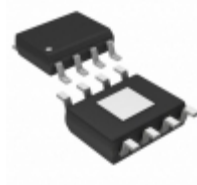
ADP1706ARDZ-1.2-R7 Analog Devices Inc. IC REG LDO 1.2V 1A 8SOIC