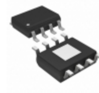
ADP1706ARDZ-1.05R7 Analog Devices Inc. IC REG LDO 1.05V 1A 8SOIC