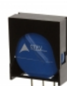
ETFV20K420E2 EPCOS (TDK) VARISTOR 680V 10KA RADIAL