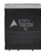
ETFV14K320E2 EPCOS (TDK) VARISTOR 510V 6KA RADIAL