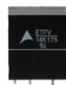
ETFV14K175E2 EPCOS (TDK) VARISTOR 270V 6KA RADIAL