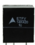
ETFV14K420E2 EPCOS (TDK) VARISTOR 680V 6KA RADIAL