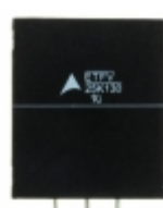
ETFV25K130E4 EPCOS (TDK) VARISTOR 205V 20KA RADIAL