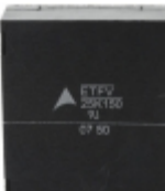
ETFV25K150E4 EPCOS (TDK) VARISTOR 240V 20KA RADIAL