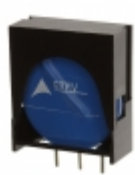
ETFV20K150E2 EPCOS (TDK) VARISTOR 240V 10KA RADIAL