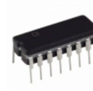
AD694AQ Analog Devices Inc. IC SGNL COND 4-20MA TX 16-CDIP