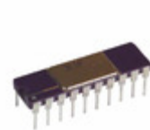
AD693AQ Analog Devices Inc. IC TRANSMITTER 4-20MA 20-CDIP