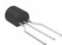
BC239BTA AMI Semiconductor / ON Semiconductor TRANS NPN 25V 0.1A TO-92