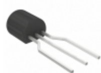
BC239ATA Fairchild/ON Semiconductor TRANS NPN 25V 0.1A TO-92