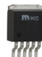
MIC37252BU TR Microchip Technology IC REG LDO ADJ 2.5A TO263-5