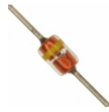
MTZJT-7227C Rohm Semiconductor DIODE ZENER 27V 500MW DO34