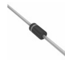
MUR1100ERLG ON Semiconductor DIODE GEN PURP 1KV 1A AXIAL