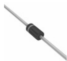
MUR1100EG ON Semiconductor DIODE GEN PURP 1KV 1A AXIAL