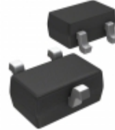
MIC803-29D3VC3-TR Microchip Technology IC MPU SUPERVISOR SC70-3