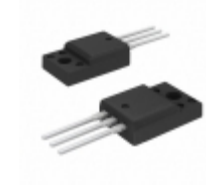
FGPF30N45TTU AMI Semiconductor / ON Semiconductor IGBT 450V 50.4W TO220F