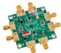
ADL5380-EVALZ Analog Devices Inc. EVAL BOARD FOR ADL5380