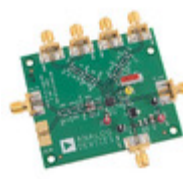
ADL5385-DIFFLO-EBZ Analog Devices Inc. EVAL BOARD FOR ADL5385