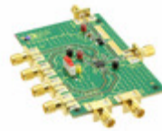
ADL5375-15-EVALZ Analog Devices Inc. EVAL BOARD FOR ADL5375