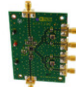
ADL5382-EVALZ Analog Devices Inc. BOARD EVAL FOR ADL5382