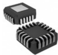
MX7549KP+ Maxim Integrated IC DAC 12BIT DUAL 20PLCC