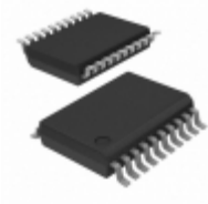
ICL3224EIA Intersil IC TXRX RS-232 3-5.5V ESD 20SSOP