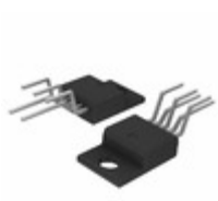
MC33166TV ON Semiconductor IC REG BUCK BOOST INV ADJ TO220