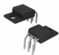
MC33166THG ON Semiconductor IC REG BUCK BOOST INV ADJ TO220