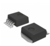
MC33167D2TR4G ON Semiconductor IC REG BUCK BOOST INV ADJ D2PAK