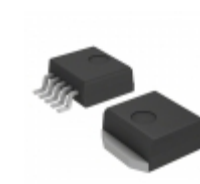
MC33167D2TR4 ON Semiconductor IC REG BUCK BOOST INV ADJ D2PAK