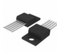
MC33166TG ON Semiconductor IC REG BUCK BOOST INV ADJ TO220