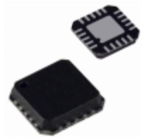
ADG788BCPZ Analog Devices Inc. IC SWITCH QUAD SPDT 20LFCSP