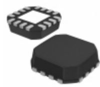
AD8305ACP-R2 Analog Devices Inc. IC LOGARITHM CONV 100DB 16-LFCSP