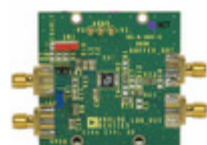
AD8304-EVALZ ADI (Analog Devices, Inc.) BOARD EVAL FOR AD8304