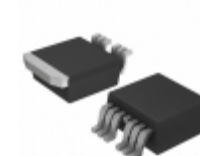
IRFS4115TRL7PP Infineon Technologies MOSFET N-CH 150V 105A D2PAK-7