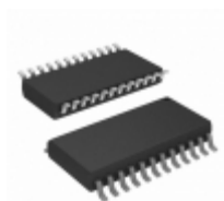
ICL3217ECB Intersil IC TXRX RS-232 3-5.5V ESD 24SOIC