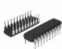
PIC16F18445-E/P Micrel / Microchip Technology COMPARATOR, DAC, 12-BIT ADCC