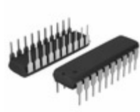
PIC16F18444-I/P Micrel / Microchip Technology COMPARATOR, DAC, 12-BIT ADCC