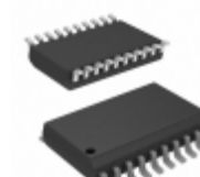
PIC16F18444T-I/SO Micrel / Microchip Technology COMPARATOR, DAC, 12-BIT ADCC