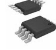
SY100EL16VEKC TR Microchip Technology IC RCVR DIFF 5V/3.3V 8-MSOP