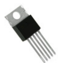
MCP1825-0802E/AT Microchip Technology IC REG LDO 0.8V 0.5A TO220-5