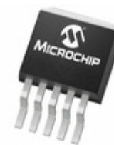
MCP1825-1202E/ET Microchip Technology IC REG LDO 1.2V 0.5A DDPAK