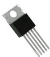
MCP1825-1202E/AT Microchip Technology IC REG LDO 1.2V 0.5A TO220-5