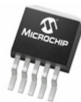
MCP1825-1802E/ET Microchip Technology IC REG LDO 1.8V 0.5A DDPAK