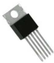
MCP1825-1802E/AT Microchip Technology IC REG LDO 1.8V 0.5A TO220-5