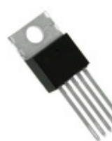
MCP1825-2502E/AT Microchip Technology IC REG LDO 2.5V 0.5A TO220-5