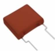
ECW-FA2J154JB Panasonic Electronic Components CAP FILM 0.15UF 5% 630VDC RADIAL