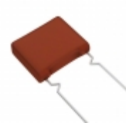
ECW-FA2J184JQ Panasonic Electronic Components CAP FILM 0.18UF 5% 630VDC RADIAL