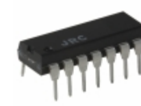
NJU7054D NJR Corporation/NJRC IC OPAMP GP 100KHZ RRO 14DIP