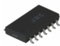
NJU7054M# NJR Corporation/NJRC IC OPAMP GP 100KHZ RRO 14DMP