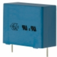
B32914A3474K EPCOS (TDK) CAP FILM 0.47UF 10% 760VDC RAD