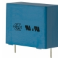
B32914A3474M189 EPCOS (TDK) CAP FILM 0.47UF 20% 760VDC RAD