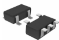
BU4225G-TR LAPIS Semiconductor IC DETECTOR VOLT 2.5V ODRN 5SSOP