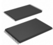
SST38VF6402-90-5I-EKE Microchip Technology IC FLASH 64MBIT 90NS 48TSOP