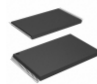
SST38VF6402-90-5C-EKE Microchip Technology IC FLASH 64MBIT 90NS 48TSOP