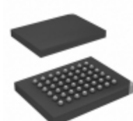
SST38VF6402-90-5I-B3KE-T Microchip Technology IC FLASH 64MBIT 90NS 48TFBGA