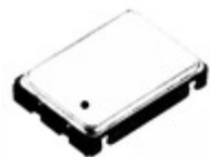
SG-8002CE 25.0000M-PCMB Epson OSC XO 25MHZ CMOS SMD