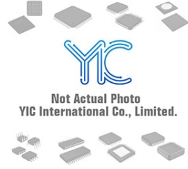
SG-8002CE 38.813000 EPSON SG-8002CE 38.813000 EPSON