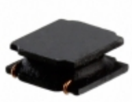
L4018C2R2MDWDT KEMET FIXED IND 2.2UH 1.44A 60 MOHM