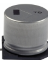
EEV-TG1E102M Panasonic Electronic Components CAP ALUM 1000UF 20% 25V SMD