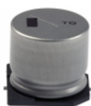
EEV-TG1E222M Panasonic Electronic Components CAP ALUM 2200UF 20% 25V SMD