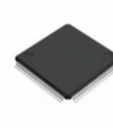
BU91530KVT-ME2 LAPIS Semiconductor LOW DUTY LCD SEGMENT DRIVERS FOR