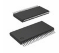
BU91600FUV-ME2 LAPIS Semiconductor LOW DUTY LCD SEGMENT DRIVER FOR