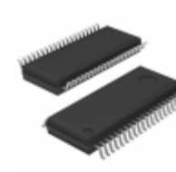
BU91600FV-ME2 LAPIS Semiconductor LOW DUTY LCD SEGMENT DRIVER FOR