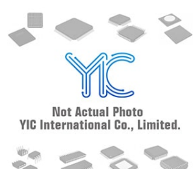
MIC5318-2.85YD5 MICREL MIC5318-2.85YD5 MICREL