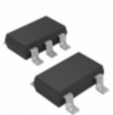
MIC5318-2.85YD5-TR Microchip Technology IC REG LDO 2.85V 0.3A TSOT23-5