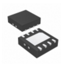
TC4452VMF Microchip Technology IC MOSFET DVR 12A HS 8DFN