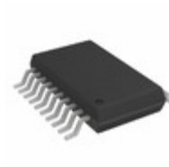
AD8436BRQZ Analog Devices Inc. IC CONV TRUE RMS-DC LP 20QSOP