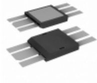
IXRFD630 IXYS RF IC MOSFET DVR RF 30A HI DCB