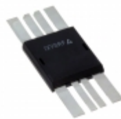
IXRFD615X2 IXYS 15A DUAL MOSFET DRIVER