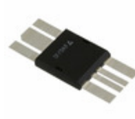
IXRFD631 IXYS IC MOSFET DVR RF 30A LOW DCB