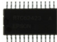
RTC-62423A:3 EPSON IC RTC CLK/CALENDAR PAR 24-SOP