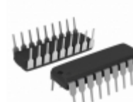
RTC-62421A EPSON IC RTC CLK/CALENDAR PAR 18-DIP