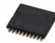
RTC-4701JE:B3 ROHS EPSON IC RTC CLK/CALENDAR SER 20-VSOJ