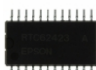
RTC-62423A:3:ROHS EPSON IC RTC CLK/CALENDAR PAR 24-SOP