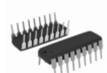
RTC-62421B EPSON IC RTC CLK/CALENDAR PAR 18-DIP