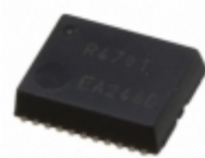
RTC-4701NB:B ROHS Epson IC TRC CLK/CALENDAR