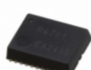
RTC-4701NB:B3 ROHS EPSON IC RTC CLK/CALENDAR SER 22-SOP