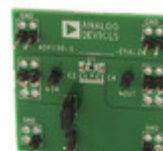
ADP150CB-3.3-EVALZ ADI (Analog Devices, Inc.) BOARD EVALUATION 3.3V WLCSP